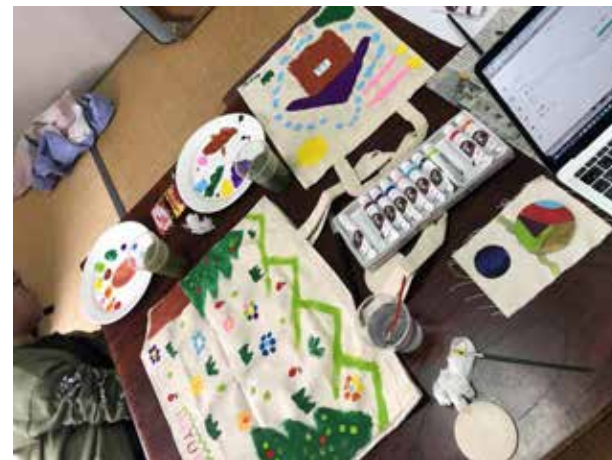
▲いよいよ試作スタート。3名のデザイナーそれぞれが自分の世界観を表現してみました。