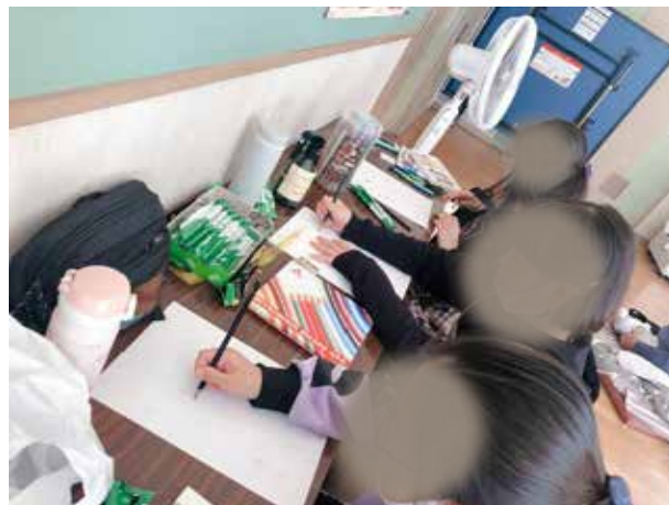
▲ 誰に何をどのように届けたいのか？じぶんたちの「やりたい」をみんなで整理しスケジュール設計。早速商品デザイン案を考え始めました。