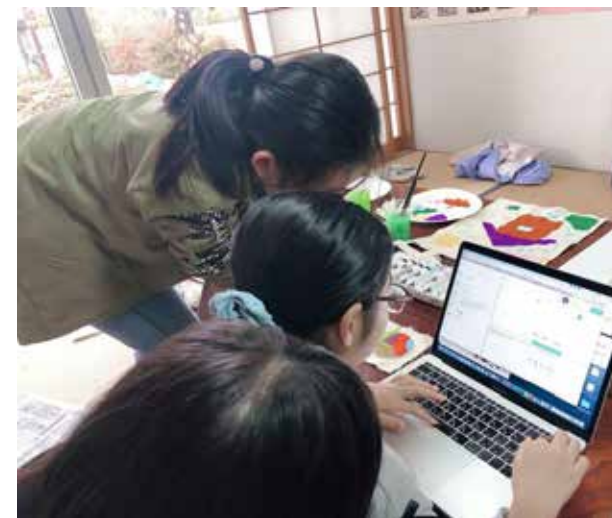
▲ 布用絵具、クレヨンなど様々試し、クレヨンだと色移りが心配、絵の具の配分を間違えて生地がよれてしまった、など改善点も見えてきました。また、同時並行でオンラインショップの作成も準備、ショップコンセプトなども自分たちで考え、サイト作成しました。