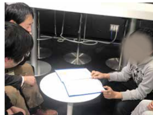
▲プロデューサー役としてINTILAQ施設長からの問いや質問に答えながら、スタジオの使用許可を頂いた。