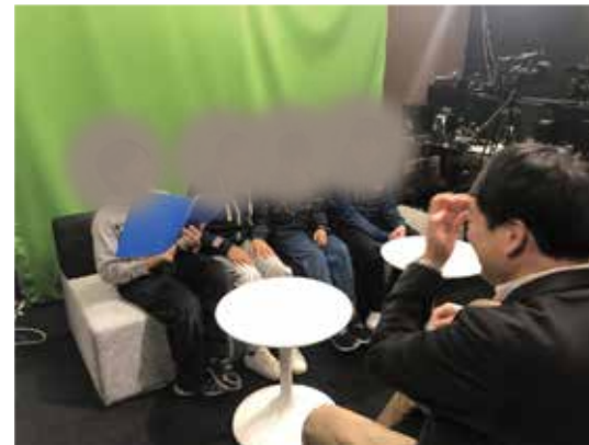
▲ラジオ番組のアイデアをまとめ、番組概要を作成し、INTILAQにてプレゼンテーションへ。